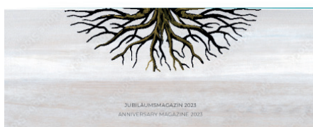
JUBILÄUMSMAGAZIN 2023 ANNIVERSARY MAGAZINE 2023

NUM-Therapie doch ist und wie wichtig es ist, dieses weiterzugeben. Blicken Sie gern mit uns zurück, ins Jetzt und in die Zukunft.